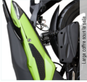
Large coffre sous la selle