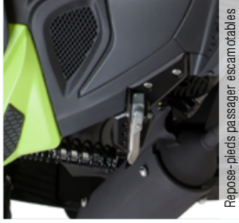
Repose-pieds passager escamotables