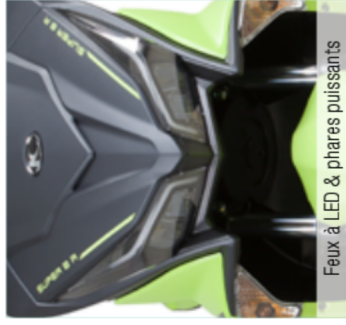
Feux à LED & phares puissants

Le Super 8 est le scooter typé sportif de la gamme des 50cc Kymco. Un look moderne et tranchant, des couleurs sublimes, de bonnes accélérations, rien ne manque à ce scooter pour vous convaincre de sauter le pas. Affichez votre style en roulant en Super 8.